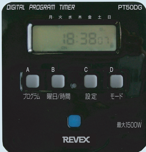
グレー PT50DG 原寸大

使用方法 タイマーをセットして、本機をコンセントに差し込み、使用する電気器具のプラグを本機に差し込みます。